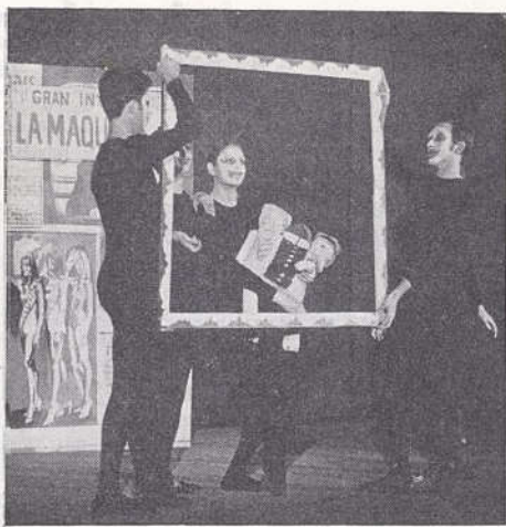
La publicitat dins El diari dels Joglars . (Foto: Barceló.)

tén d'aconseguir-la mitjançant l'aplicació d'una òptica determinada als fets narrats. Per dissort, aquesta òptica resulta insuficient: El diari no traïx una visió crítica de la societat, esbossada en una direcció o en una altra, sinó que es resol en una sèrie de pizzicatos que, per bé que evidencien un cert enginy, manquen de coherència. Més d'una vegada, però, la caricatura és massa fàcil i voreja el terreny de la vulgaritat.