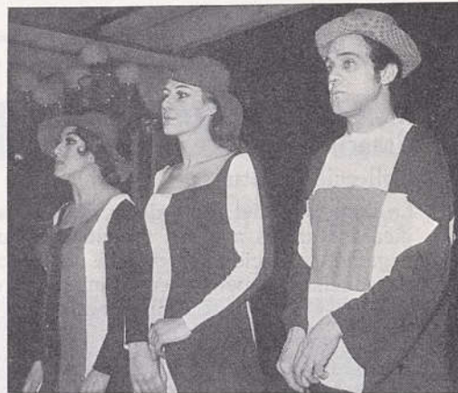
Una escena de Manicomi d'estiu o la felicitat de comprar i vendre.

Aquest espectacle de cabaret, de Jaume Vidal Alcover (La Cova del Drac, 22-XII-68), s'insereix dins l'estil — és prematur encara d'anomenar-lo tradició — que a la temporada passada i al mateix local inicià Dones, flors i pitança , de Maria-Aurèlia Capmany; enfilall de cançons junyides per mig de diàlegs breus però maliciosos, de vegades cinics, els quals fan sàtira dels costums d'avui en raó dels d'ahir, i dels d'ahir en raó dels d'avui. Mancat d'anècdota, Manicomi d'estiu o la felicitat de comprar i vendre traïx, però, una actitud: la que l'autor ens proposa d'utilitzar per a contemplar el món i els tripijocs que s'hi couen. L'home — i la dona, és clar —, se'ns apareix així com un petit ésser egoïsta a la recerca de motius que li permetin de sentir-se bo, sense, però, haver de deixar de banda els seus capricis i les seves niciees. Les referències a fets concrets — cançons i diàlegs hi abunden — foren subratllades pel públic amb rialles i aplaudiments.