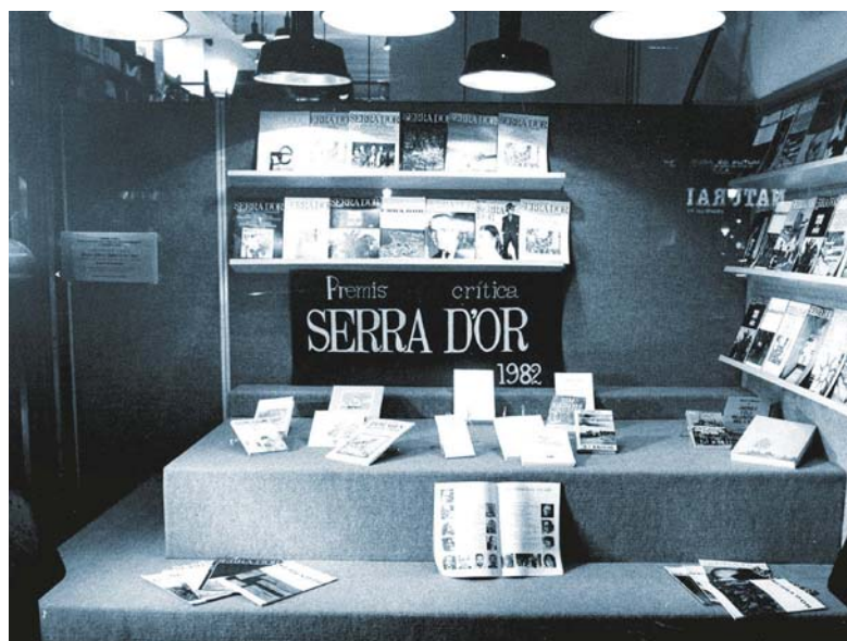
L'aparador d'Ona anuncia els Premis de 1982.