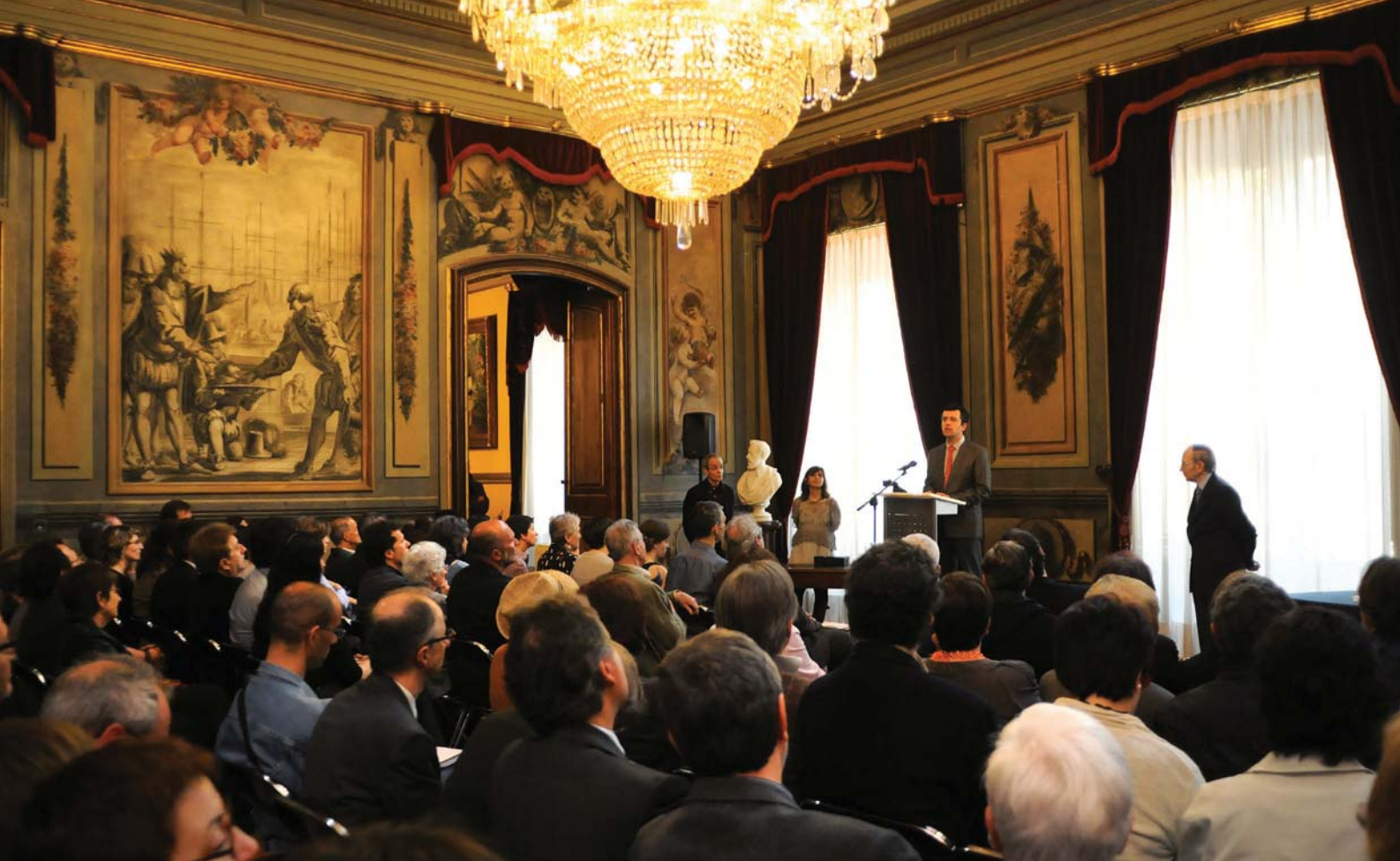
Des del 2012, l'acte de proclamació se celebra a les dotze del migdia al Palau Moja de Barcelona.

rir-se. Els veredictes corresponents apareixen al número de maig de «Serra d'Or» (pp. 22-23), amb jurats idèntics als del 1982. La «proclamació» dels premis va tenir lloc un cop més a la llibreria Ona, el 25 de maig i hi va fer «un breu parlament», amb «algunes reflexions sobre literatura i llengua», Josep M. Llompart.