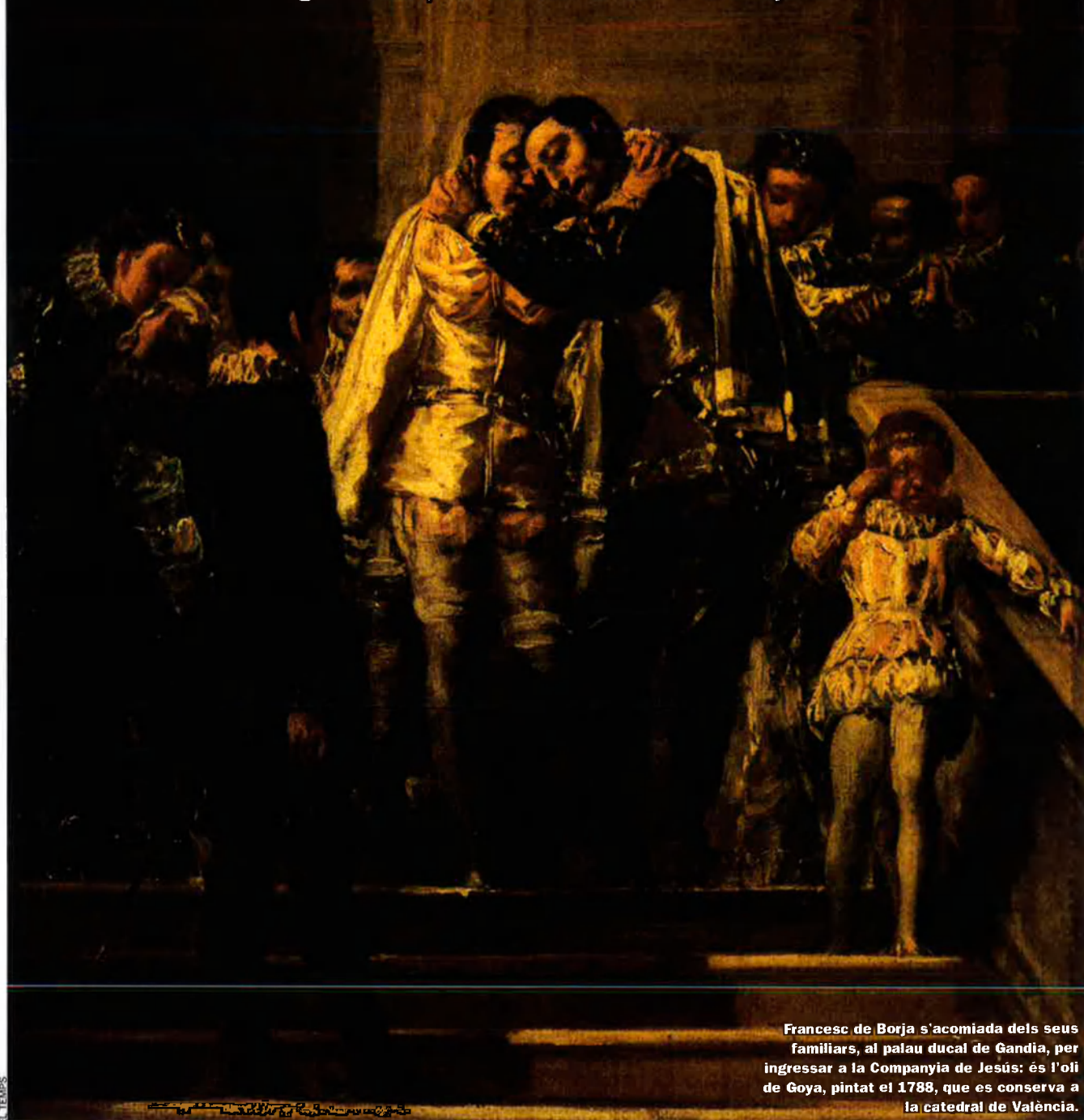
Francesc de Borja s'acomiada dels seus familiars, al palau ducal de Gandia, per ingressar a la Companyia de Jesús: és l'oli de Goya, pintat el 1788, que es conserva a la catedral de València.

A punt de tancar-se l'Any Borja propiciat pel cinquè centenari del naixement del sant de la nissaga famosa, duc de Gandia i general dels jesuïtes, un simposi internacional i l'edició del seu diari ens acaben d'acostar a la figura complexa de Francesc de Borja.