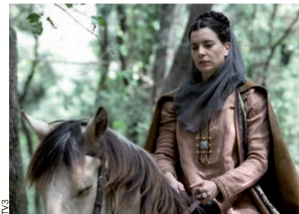
Ermessenda es beneficia de l'estat de gràcia total de Laia Marull.

Ermessenda té molts elements a favor: per a començar, el fet de desvetllar una figura pràcticament desconeguda de la història del Principat, amb atributs d'energia molt positiva per a instal·lar en l'imaginari popular un cert feminisme pioner i la consolidació que els Països Catalans van ser obra de voluntats polítiques intel·ligents, comparables a les de qualsevol país d'Europa. Falta molt per filmar de la nostra història, i Ermessenda obre un territori verge que pot ser indispensable com a aportació didàctica a un gran problema: els catalans desconeixen els detalls del seu passat. A més a més, Ermessenda conté imatges concretes