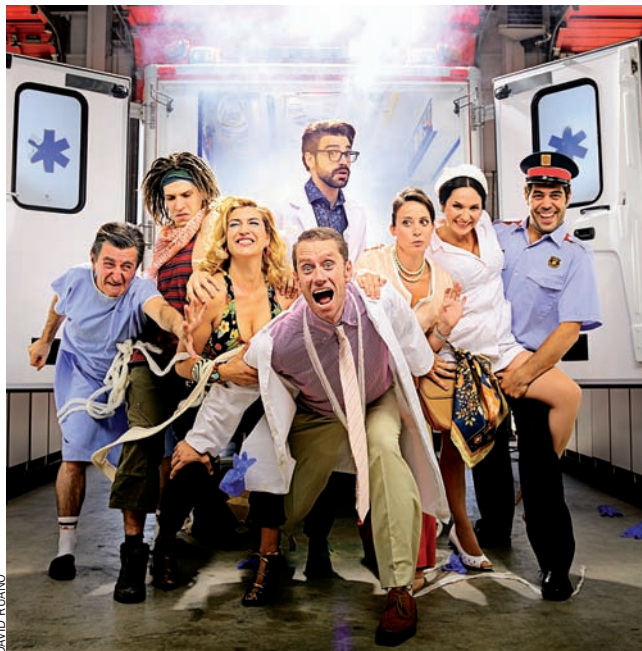
L'esbojarrat conjunt d'actors.