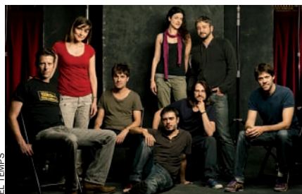
Els actors maleïts.

14 de setembre del 2004. Un grup d'artistes presenta l'estrena de l'espectacle Xirgu al Teatre Remea. Segons una actriu, el fantasma de Margarida Xirgu es passeja pel teatre. Malgrat l'avertiment, la funció