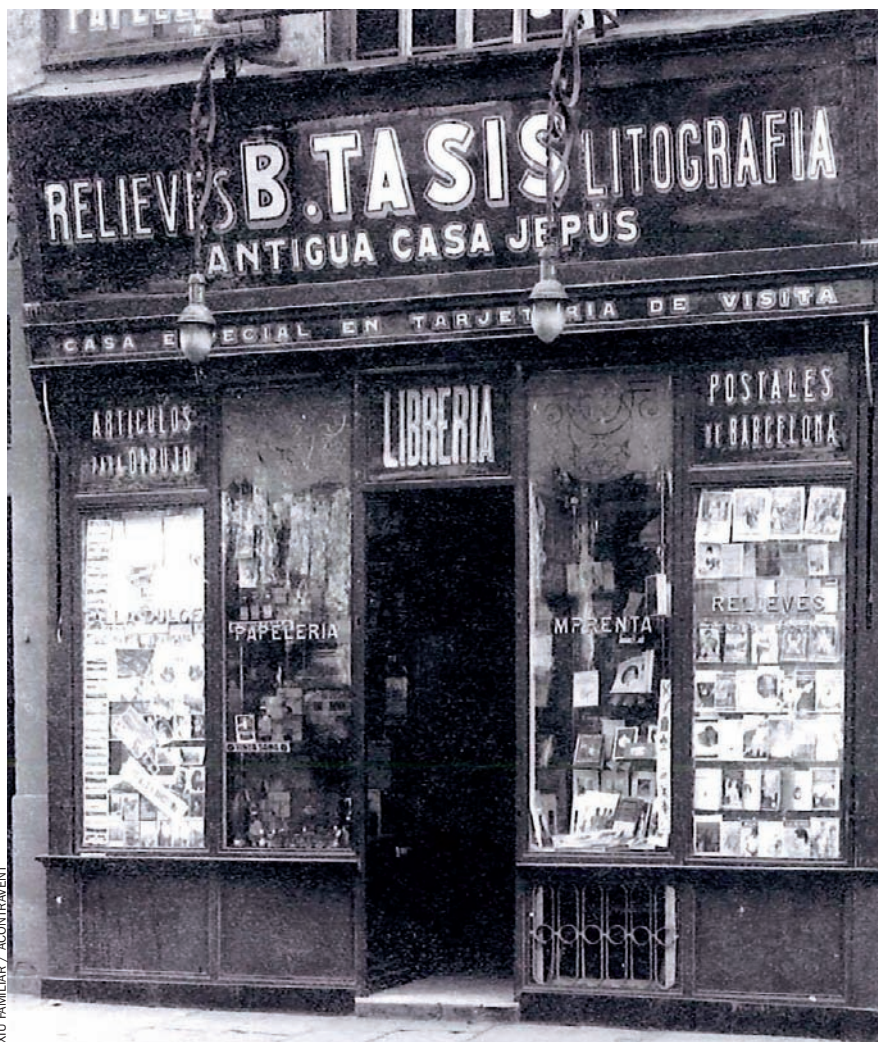
ARXIU FAMILIAR / ACONTRAVENT

Tasis va qualificar de poètica i sensu- al l’etapa que va travessar dels catorze