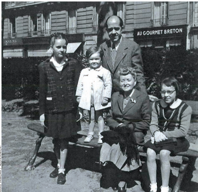
ARXIU FAMILIAR / ACONTRAVENT