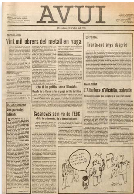
Coberta del primer exemplar del diari Avui, als quioscs el 23 d'abril de 1976, i coberta d'EL TEMPS número zero, que va editar-se la setmana del 4 al 10 d'abril de 1984 a València.