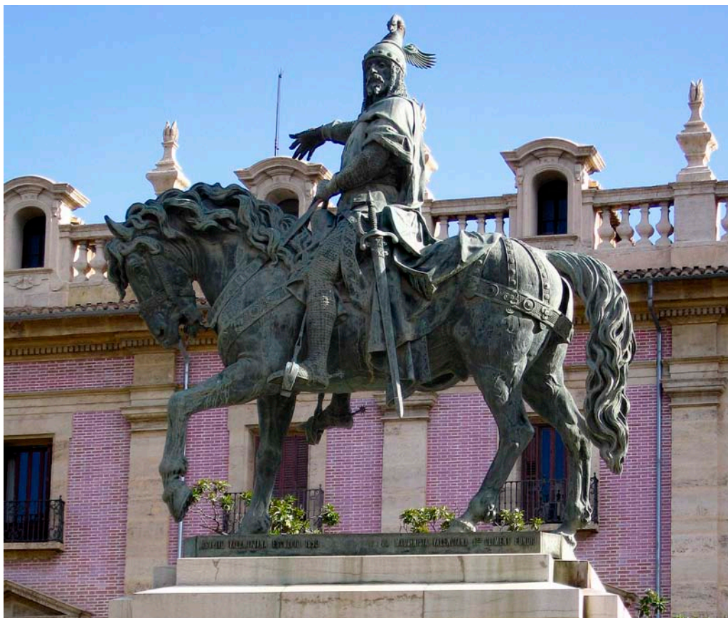
A València, el blaverisme incipient triava el Cid conqueridor (a sota), per davant de Jaume I i condemnava la llengua pròpia a l'àmbit domèstic i renunciava a qualsevol identitat diferenciada.