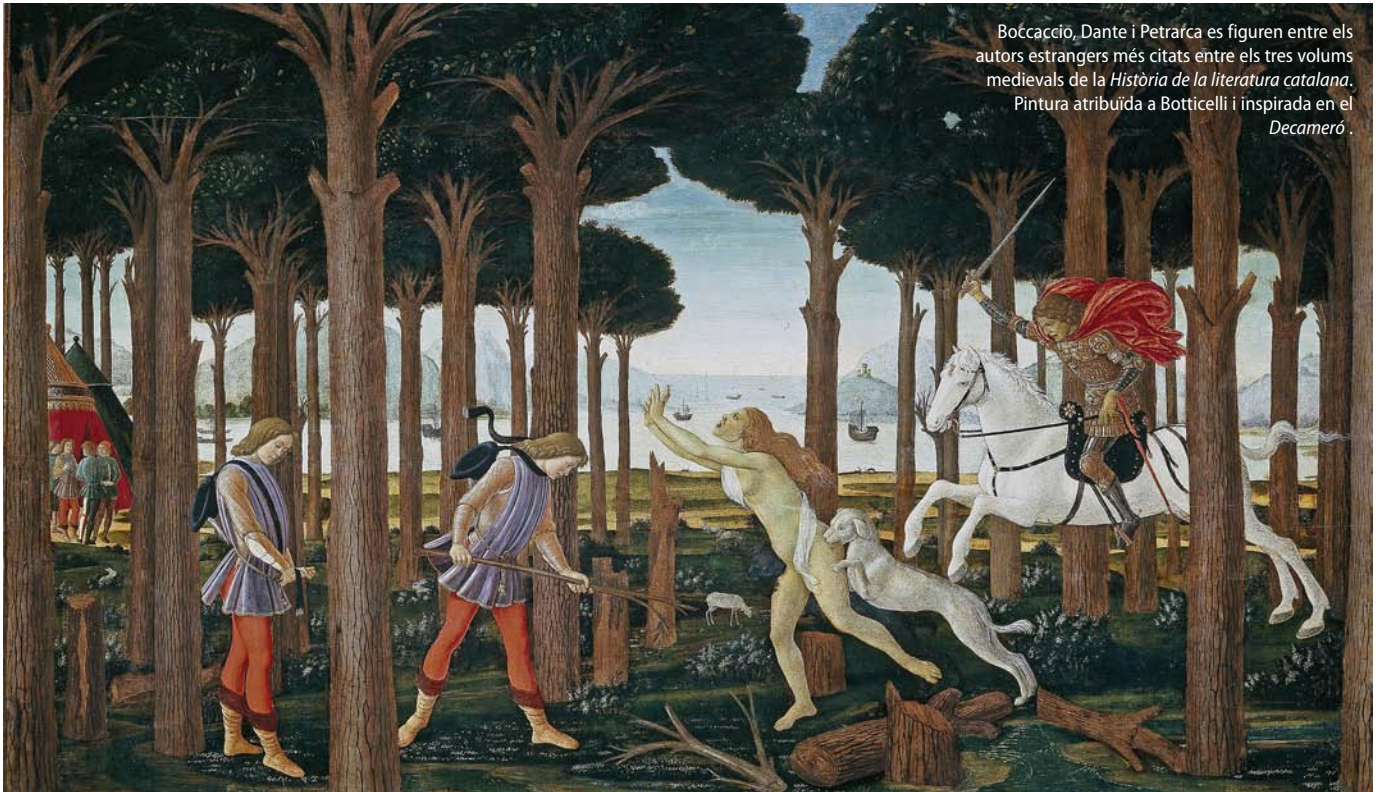
Boccaccio, Dante i Petrarca es figuren entre els autors estrangers més citats entre els tres volums medievals de la Història de la literatura catalana . Pintura atribuïda a Botticelli i inspirada en el Decameró .

→ Pel que fa a l'emergència dels primers textos en prosa catalans de gran alè al darrer terç del segle XIII ha calgut, indica la directora dels volums, afrontar un conjunt de singularitats, la més destacable de les quals és la del Llibre dels fets de Jaume I.