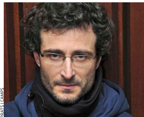
PREATS I CAMPS

Premi Ciutat de Tarragona Pin i Soler Angle Editorial, Barcelona, 2015 Narrativa, 167 pàgines