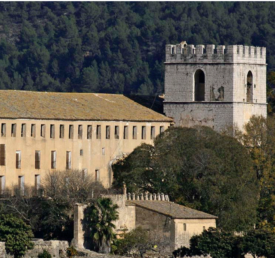
MONESTIR. En la imatge gran, vista general de Sant Jeroni de Cotalba. En la fotografia de baix, les cortines que oculten la zona de soterrament de Pere Marc. A sota, les parts del monestir que envolten les tombes dins i fora.