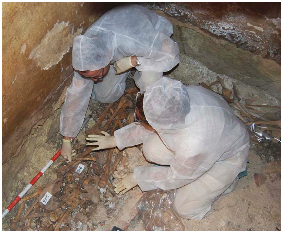
En la imatge, l'equip investigador durant els treballs arqueològics. En la fotografia es pot apreciar perfectament la disposició d'un dels cossos investigats.

De cap a peus, s'han trobat 24 botons de fina orfebreria, joies del seu vestit de núvia. Era costum que les novençanes mortes, embarassades o no, foren soterrades amb el vestit de noces perquè feia molt poc que s'havien casat i eren encara pures de cos i d'ànima. Isabel va morir als set mesos de casada. Al voltant de les