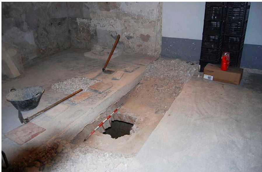
En la pàgina anterior, detall de la capella dels Marc. A la fotografia de dalt, entrada a la cripta.

En opinió dels membres de l'equip investigador, la reconstrucció del mapa de capelles il·luminades pel pintor Nicolau Borràs i la lògica simbòlica de les imatges que representa, així com la troballa de dos capitells del segle XV en aquest espai, ambdós posteriors als enterraments, ens aportarien una informació molt exacta de "tot el món representatiu i de motius relacionats amb la família del poeta".