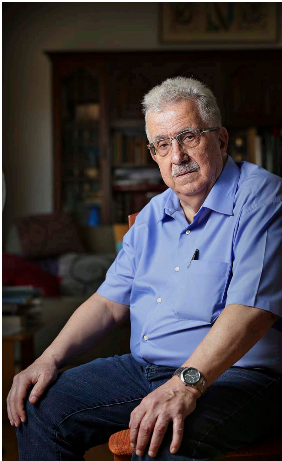
→ L'historiador Josep Fontana, una de les veus més autoritzades i respectades de la historiografia catalana.