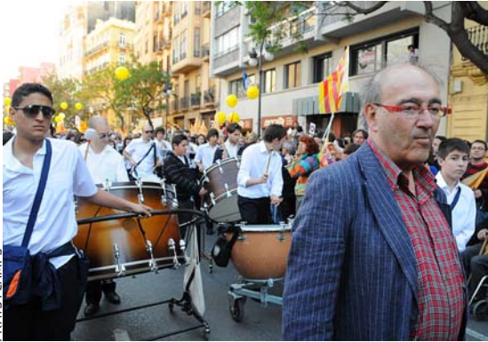
PRATIS I CAMPS