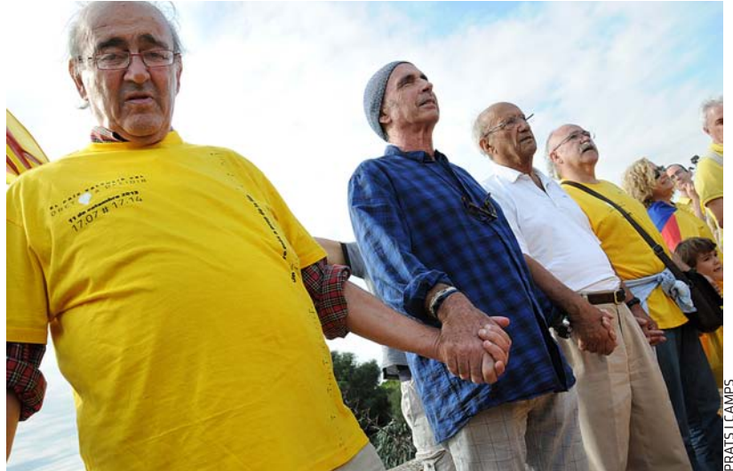
PRATIS I CAMPS

El músic cosmopolita i de projecció internacional, de fet, sempre tenia l’ànchora a Vinaròs. A prop de la mar, dels seus peixos i arrossos. Dels seus amics i veïns. “No vaig d’artista per la vida,