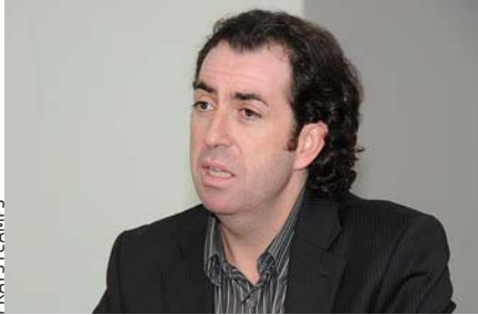
PRATS I CAMPS

El gruix de la producció literària de Pere Joan Martorell (Lloseta, Mallorca, 1972), allò que li ha proporcionat més prestigi, el conforma la poesia. No obstant això, fa anys que combina l'operatiu poètic amb incursions en la novel·la com ara Nocturn amb estrelles (2006) o Llibre de les revelacions (2007). La seua irrupció definitiva com a narrador podria ser La memòria de l'Oracle , publicada aquesta