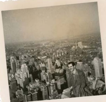
ARXIU COMARCAL DEL PLA DE L'ESTANY / FONTS CARLES FONTSERÈ / TERRY BROCH