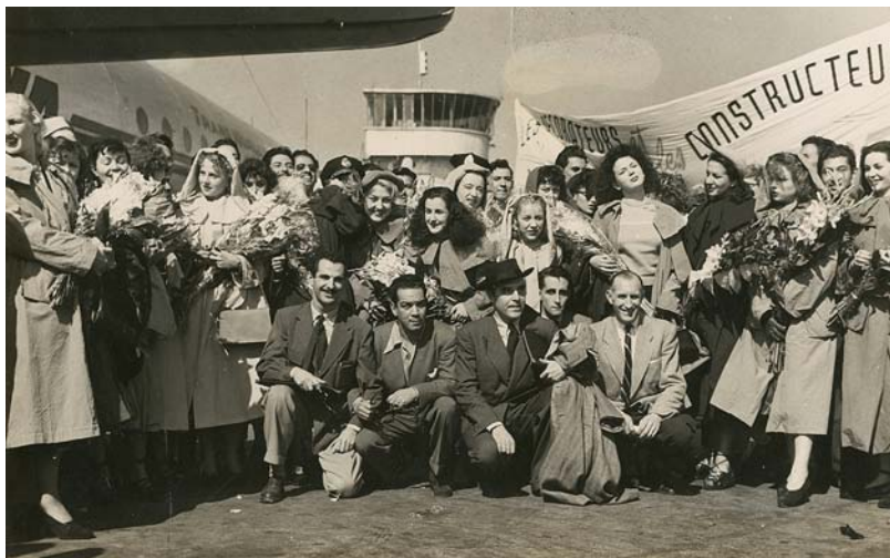
Retrat de grup de la companyia de l'espectacle Bonjour México . Carles Fontserè i Mario Moreno, Cantinflas.

Però tornant al tema nazi, en algun moment del documental es mostra taxatiu: "No crec que