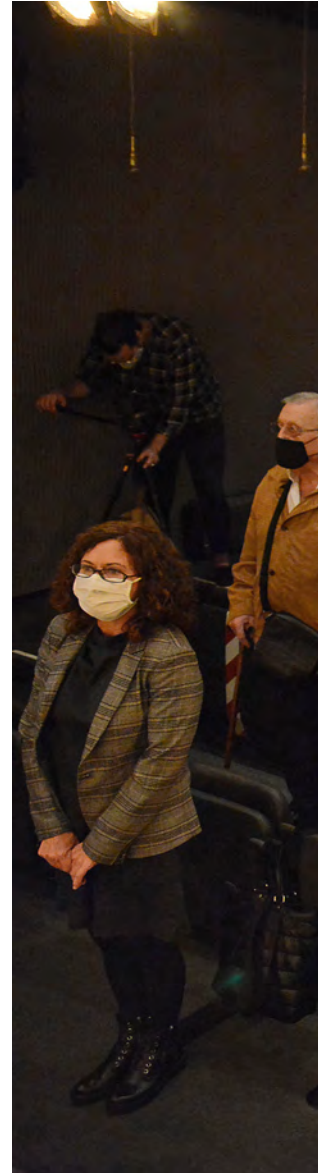
El moment final de l'acte, amb la interpretació de La Muixeranga .