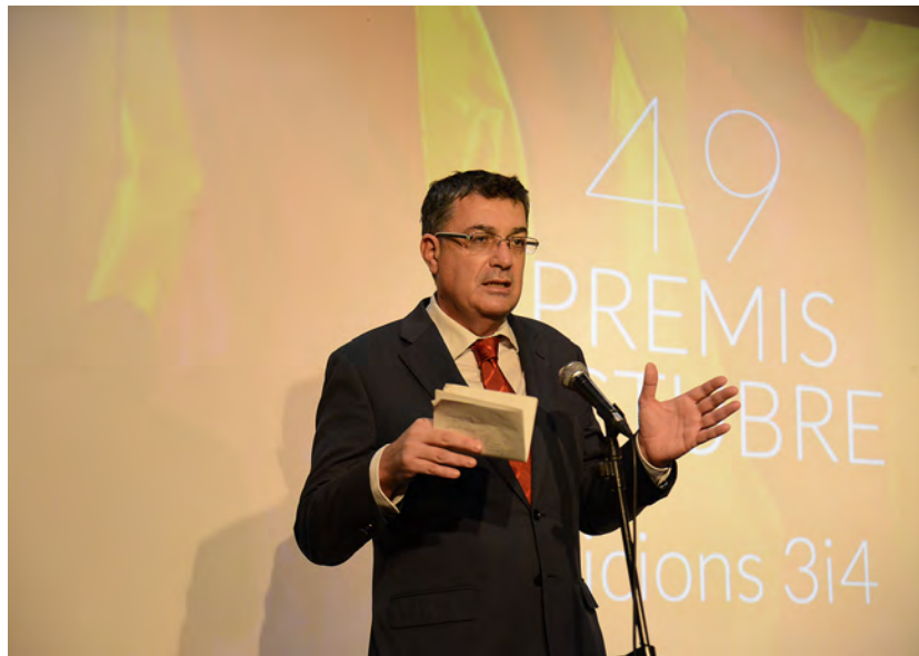
El president de les Corts, Enric Morera, dirigint-se al públic present.

→ gona fila a propòsit de les memòries de l'activista Toni Royo. “La gent que ha treballat tota la vida pel país sense esperar que se’ls premie o se’ls afa- lague”, va dir, el dic de contenció “contra els que volen anorrear-nos com a país i com a cultura”. “Com a escriptor”, va concloure, “vull contribuir a fer més llarga aquesta segona fila”. Un dels moments emotius del matí.