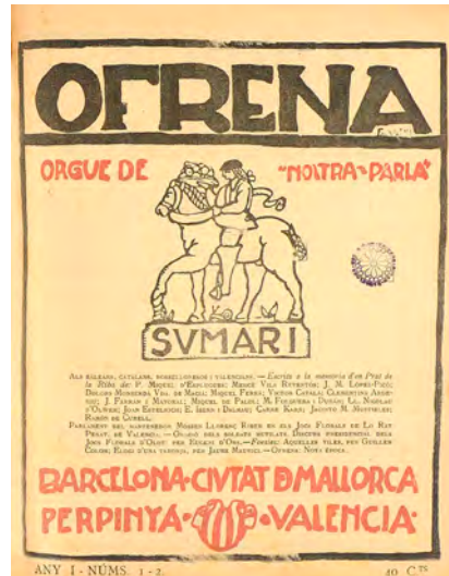
Palestra i Nostra Parla foren entitats influïdes pels objectius de Prat de la Riba.