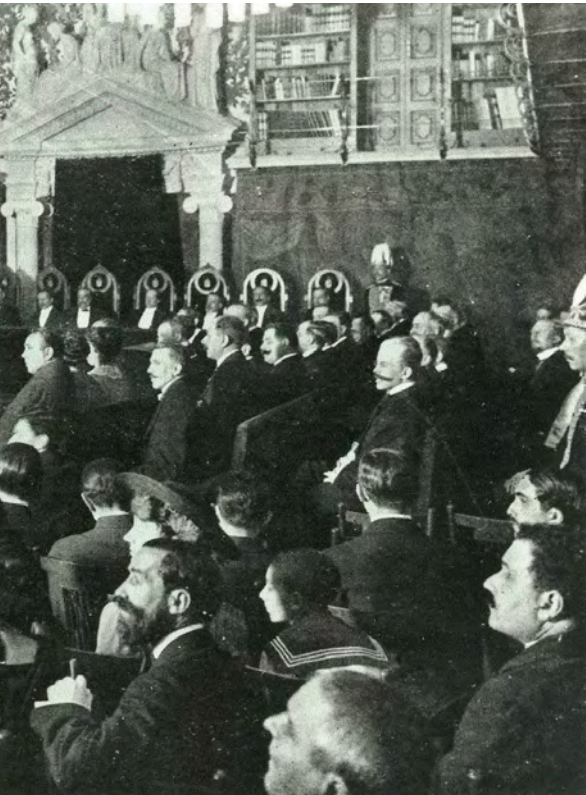
Sessió de l'Institut d'Estudis Catalans a la Biblioteca de Catalunya el 1914. Totes dues institucions foren impulsades per Prat.

d'atribuir una manera de ser concreta i inalterable a cada comunitat nacional. Prat, per tant, no era cap anomalia en el camp teòric europeu.