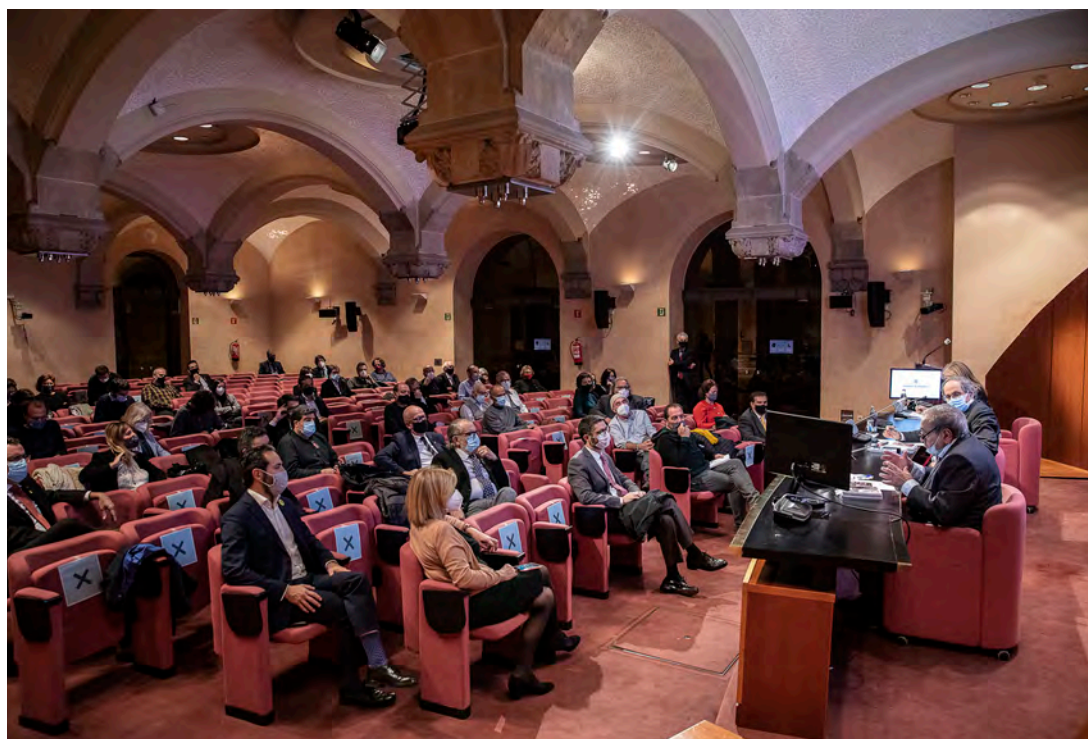
Pla general de l'acte de presentació dels volums d'Edicions 3i4 al Palau de la Generalitat de Catalunya.

Confidencial és el títol del recull d'articles de 3i4 que Xavier Vinader va escriure a EL TEMPS du- →