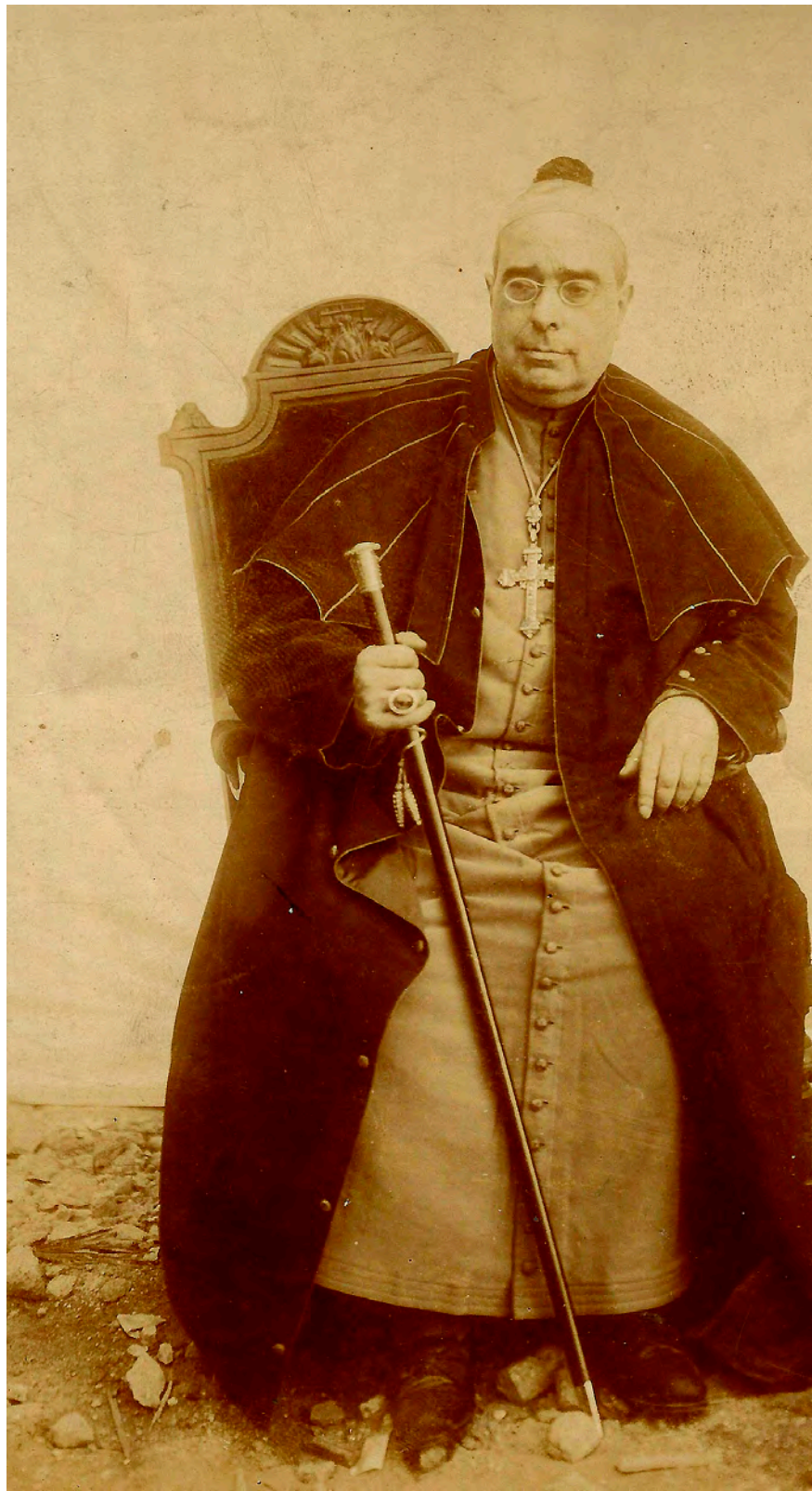
Torras i Bages va encarnar la idea del regionalisme conservador i catòlic català. El que va començar com un projecte espanyolista basat en la regió catalana es va convertir en nacionalisme català entre les Bases de Manresa i el Desastre de 1898.

Per descomptat, Catalunya podia ser l'essència tradicional catòlica espanyola si s'obviava el liberalisme, el republicanisme i el bullanguisme de Barcelona. En la bombolla conservadora d'homes com Duran i Bas i Llorens i Barba — ambdós van ser figures clau en el creixement de Torras i Bages— aquesta ficció es podia mantenir precàriament. Així i tot, Barcelona era un focus de liberalisme indiscutible i inigualable. No debades, la gran facció liberal catalana de la