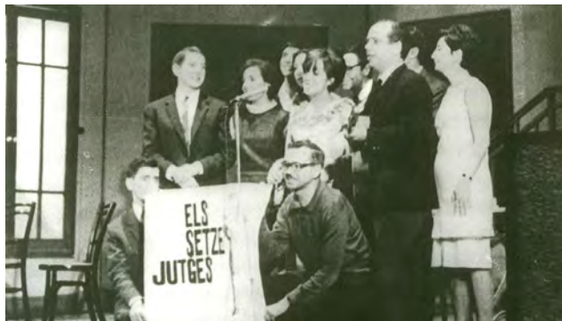
Els Setze Jutges.

Publicat el seu senzill el mateix 1968, ràpidament es va convertir en un himne de denúncia a la repressió política franquista. Arran d'un concert a la Cova del Drac, la censura va prohibir que s'emetés per la ràdio i s'interpretés en re-