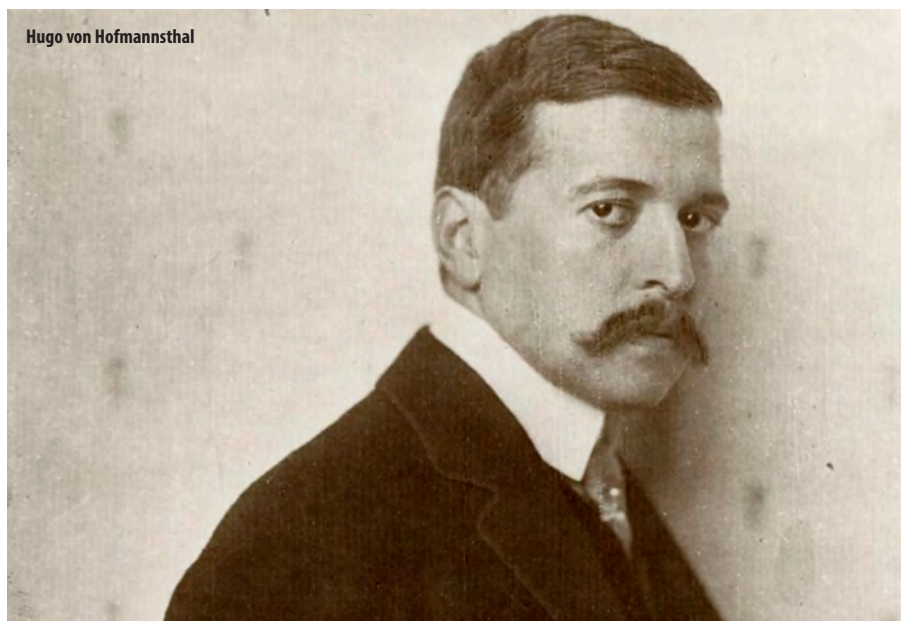
Hugo von Hofmannsthal

Els pols, malgrat la distància, acaben complementant-se i formant part d'una