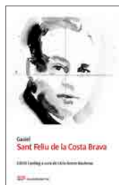
Sant Feliu de la Costa Brava GAZIEL

Edició a cura de Manuel Llanas Barcelona, 2021 PAM 171 pàgines