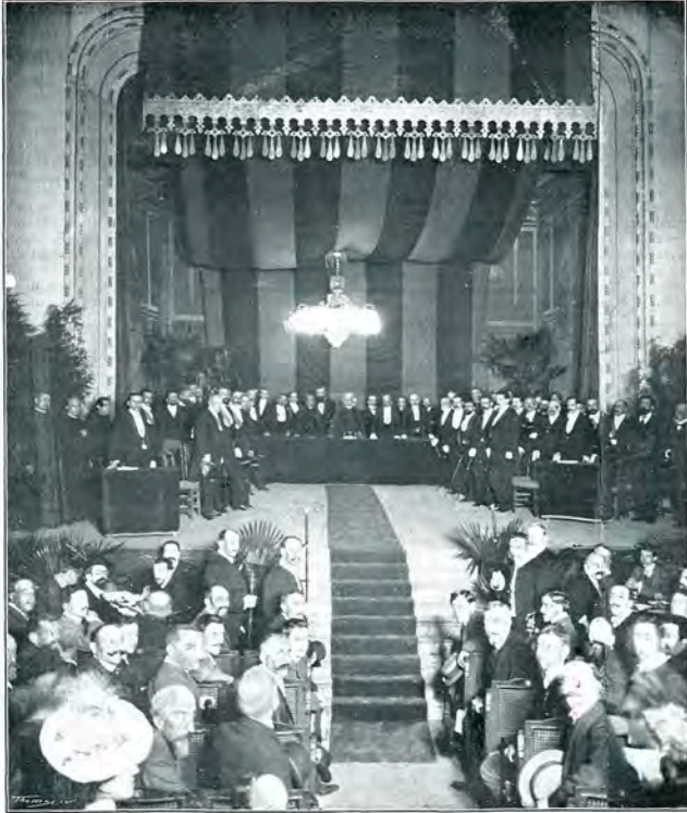
SESSIÓ D'OBERTURA — PRESIDÈNCIA