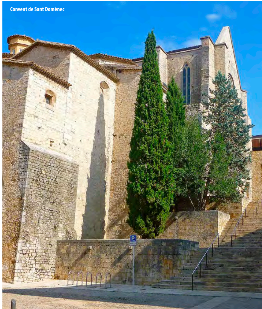
Convent de Sant Domènec

L'historiador ha traduït, estudiat i publicat diversos documents d'Eimeric sobre processos pràctics d'inquisició i els coneix bé, però prefereix destacar l'opinió d'una historiadora llunyana, sense prejudicis de cap tipus a favor o en contra d'Eimeric: “Després de llegir aquests documents que vaig publicar,