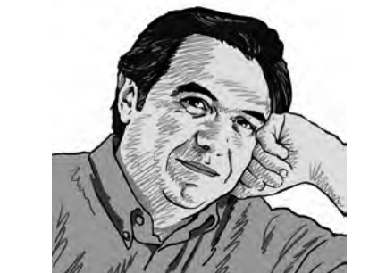
MARTÍ DOMÍNGUEZ @MartíDominguezR

Al darrere d'aquest llibre hi ha un dolor aclaparat, una lucidesa punyent, un horror al que és evident que s'esdevindrà. Roth defensa en els darrers capítols la innocència del poble jueu, i escriu frases com "L'arrogància dels jueus era, de fet, humilitat" o "No tan sols van donar a llum el redemptor, sinó que també el