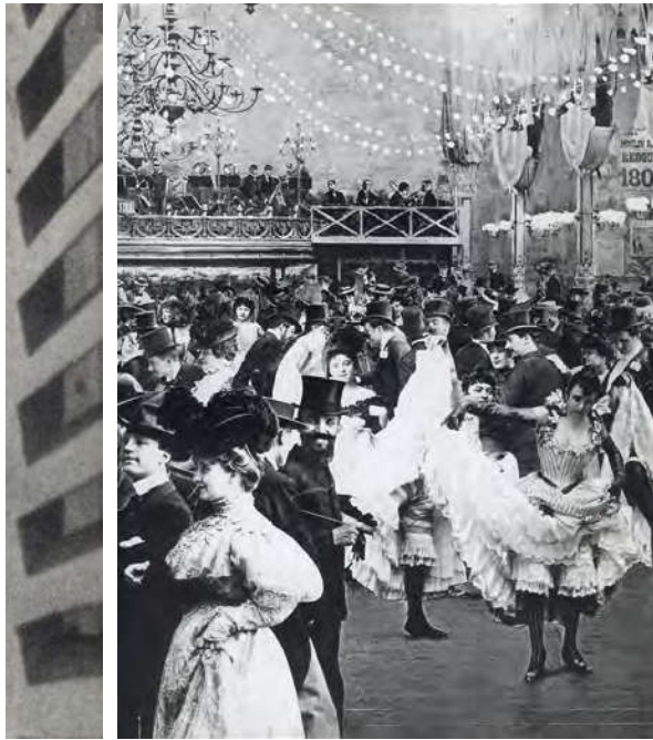
Els balls del cancan encisaven la gernació que cada nit omplia el Moulin Rouge.

en un missió d'estat, rere de la qual hi havia totes les institucions, en especial el Govern i la municipalitat de París, empresaris i, en fi, tot el país. En aquells moments, es creia en el progrés sense fi, basat en les constants innovacions tecnològiques. Tot el que fos maquinària i invents fascinava una gran quantitat de gent. Per tant, per força les màquines havien de ser protagonistes de l'Exposició. Així, per exemple, es dissenyà la que seria La Galerie des Machines (el 'Pavelló de les màquines'), per mostrar les últimes novetats i glosar el poder d'aquests enginyers per transformar la societat. El segle a punt de començar, el XX, havia de ser —es pensava aleshores— del gran progrés gràcies a tot tipus de maquinàries. També es va pensar, com en efecte es va fer, a construir un petit tren per moure els assistents per tot el recinte del Camp de Mart que acolliria l'Exposició, a més de ser un implícit homenatge al sistema de transport de vapor que havia canviat la mobilitat popular. El segle XX era a tocar i la industrialització, el tren, les màquines en general eren sinònim de progrés i de futur. El ferro, en fi, esdevenia el gran protagonista d'aquell temps.