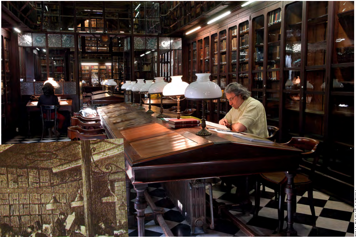
TINA BAGUE / ARXU