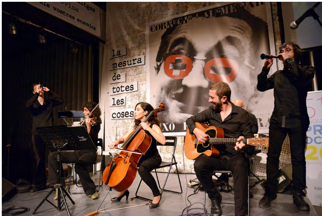
CLOENDA. Com sempre, la interpretació de la "Muixeranga" va tancar l'acte de lliurament dels Octubre.