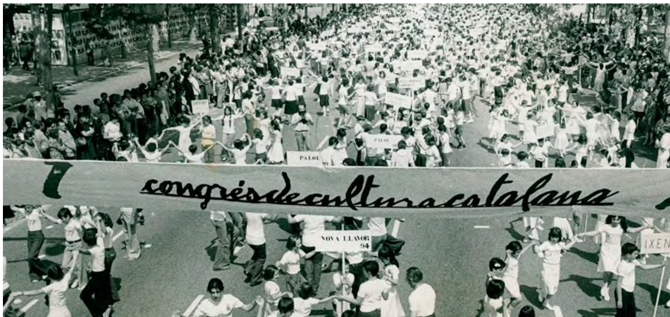
FUNDACIÓ CONGRÉS DE CULTURA CATALANA