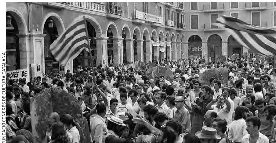
FUNDACIÓ CONGRÉS DE CULTURA CATALANA

a subscripcions@eltemps.cat o telefona al 902 131 025