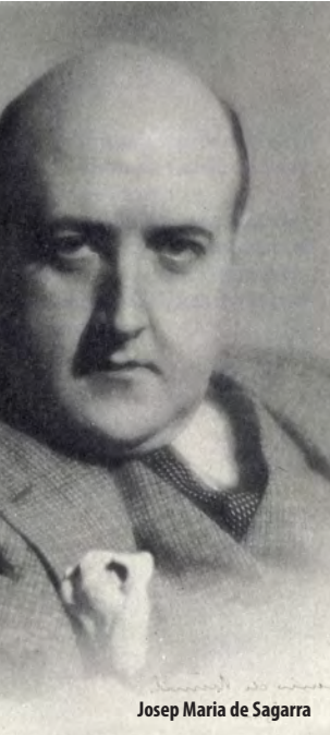
Josep Maria de Sagarra