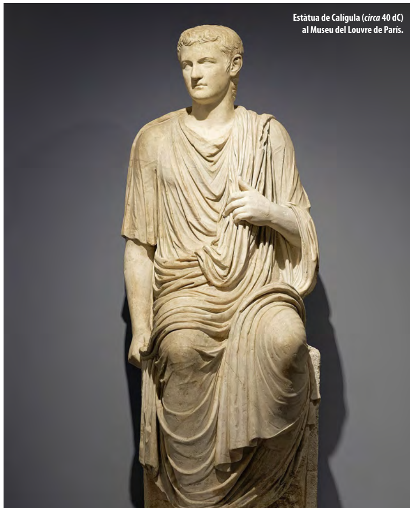
Estàtua de Calígula (circa 40 dC) al Museu del Louvre de París.

El govern de Calígula va durar poc més de tres anys, però varen ser tan frenètics que els historiadors, tant contemporanis com posteriors, han trobat dificultats per ordenar els esdeveniments d'aquells dies tumultuosos. El que sí que se sap del cert són alguns trets que marcaren les jornades més intenses de Calígula: el possible incest amb la seva germana Drusil·la, l'adopció de certs cultes orientalitzants, un macabre sentit de l'humor o la ferma creença d'haver esdevingut una