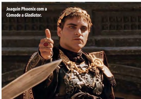
Joaquin Phoenix com a Còmode a Gladiator .

→ de Gladiator gràcies al talent i al carisma d'un Joaquin Phoenix en estat de gràcia. La segona és que Leonardo DiCaprio va reconèixer inspirar-se en el Calígula de Malcolm McDowell per interpretar The Wolf of Wall Street de Martin Scorsese.