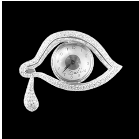
Abb. 2: Dalí, The Eye of Time , 1949 (in: Descharnes/ Neret, 1993: 338; © Salvador Dalí, Fundació Gala-Salvador Dalí / VG Bild-Kunst, Bonn 2009).