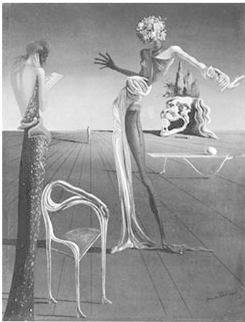
Abb. 1: Dalí, Femme à tête de roses , 1935; Zürich, Kunsthaus (© Salvador Dalí, Fundació Gala-Salvador Dalí / VG Bild-Kunst, Bonn 2009).

Blumenbouquet; die Bewegung der Frau, die tastende Spreizung ihrer Arme und Hände vermitteln Blindheit und Orientierungslosigkeit. Ungeachtet dessen scheint eine ihr gegenüberstehende Frau ganz in die Studie eines Blattes vertieft, womöglich eines erläuternden Textes zum Bild des hybriden „Objektes“ vor ihr, während die endlose, fliehende Landschaft hinter der im Prozess der Metamorphose befindlichen Frau eine bereits erstarrte, einsame Figur zeigt. Im Gegensatz zu dem Prozess, der den Menschen hier langsam in einen unbelebten Zustand überführt oder bereits überführt hat, wie die starre Figur im Hintergrund vermuten lässt, beginnen sich die dargestellten Möbel zugleich wie lebendig zu regen. Unter diesen Gesichtspunkten interpretiert, zeigt Dalís Bild eine düstere Vision des unaufhaltsamen Überganges alles Lebendigen ins Unbelebte und umgekehrt. Dieser wird von außen stehenden Betrachtern scheinbar teilnahmslos zur Kenntnis genommen; offenkundig ist auch hier bereits eine Art emotionaler Erstarrung eingetreten.