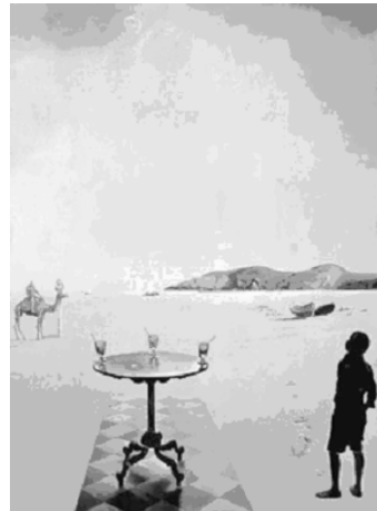
Abb. 4: Dalí, Table solaire , 1936; Rotterdam, Museum Boymans van Beuningen (© Salvador Dalí, Fundació Gala-Salvador Dalí / VG Bild-Kunst, Bonn 2009).

Diese Art der Wahrnehmungsirritation wird von Dalí folgendermaßen beschrieben: „Es war, als übten meine zu brennstarken Linsen gewordenen Augen ihre Vergrößerungskraft an einem begrenzten, aber deliriös-konkreten Sichtfeld; und all das zum Nachteil der übrigen Welt, die nach und nach vollkommen verlöschte...“ (Dalí, 1947: 69). Ähnlich der paranoiden Wahrnehmung erschließen sich somit unendlich viele überscharfe, doch separiert scheinende Bedeutungsebenen, deren Auslegung letztendlich kein schlüssiges Gesamtbild liefern kann, sondern im Gegenzug unendlich viele Interpretationsmöglichkeiten eröffnet.